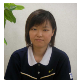
管理者・ケアマネージャー

とは言え、利用者がサービスを選択しにくい立場に置かれていることに変わりはありません。そんな中での介護保険制度の要となる、ケアマネージャーと居宅介護支援事業所も地域に点在こそしていますが、利用者にとって色々な意味でわかりにくい事業所であることは確かです。その居宅介護支援事業所がこの度、「介護老人保健施設 いつでも夢を」に7月開設いたしました。「何をしてくれるところ?」「介護について、制度の事、困っている事等 相談する窓口です」とにかく何でも聞いてください。居宅介護支援事業所、そしてケアマネージャーは利用者の代弁者です。ささいなことでも、気軽に相談して下さるような窓口を目指しますので、どうぞよろしくお願いたします。